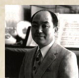
音楽家・斎藤高順

今回は、斎藤高順の子息たちが結成したサイトウ・メモリアルアンサンブルが、「浮草」の音楽をアレンジしながら、サイレント映画「浮草物語」に生演奏をつけ、佐々木亜希子の活弁とともにお送りする、世界初企画！