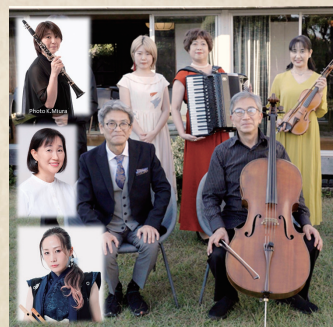
生演奏 サイトウ・メモリアルアンサンブル